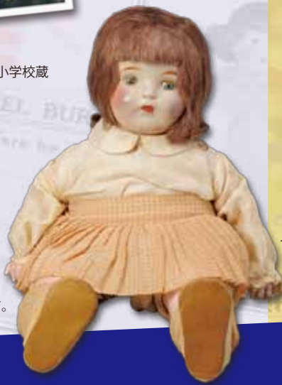
ヘレンウッド ／福知山市蔵